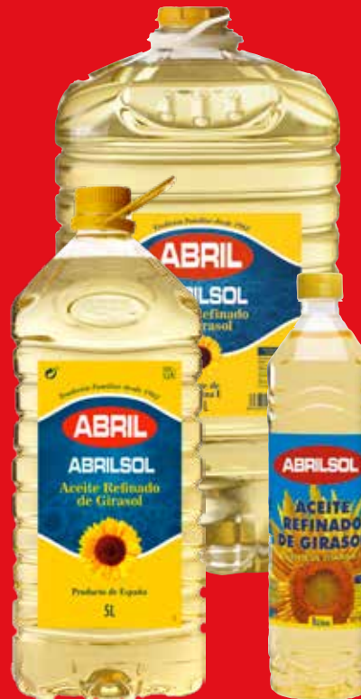
ABRILSOL ACEITE DE GIRASOL 1,5 O 25 L