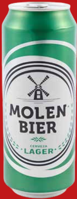
MOLEN BIER CERVEZA 50 CL