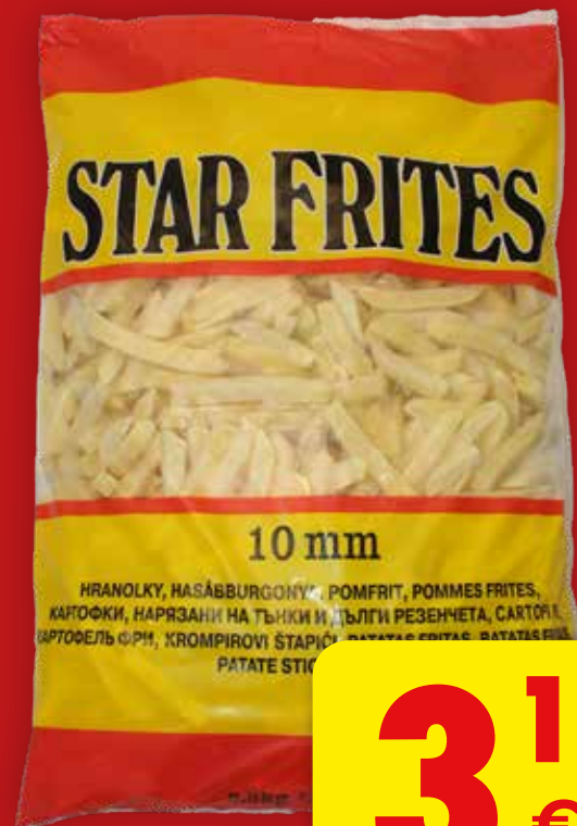
STAR PATATA PREFRITA 10MM 3/8, 2,5 KG

1 PACK DE COCA COLA REGULAR 4 UDS X 20 CL