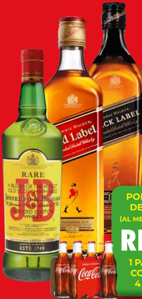
J&B WHISKY SCOTCH BLENDED 70 CL

LOS 5L SALEN 7,45€ CON I.V.A. 8,20€ LOS 25L SALEN 37,25€ CON I.V.A. 40,98€