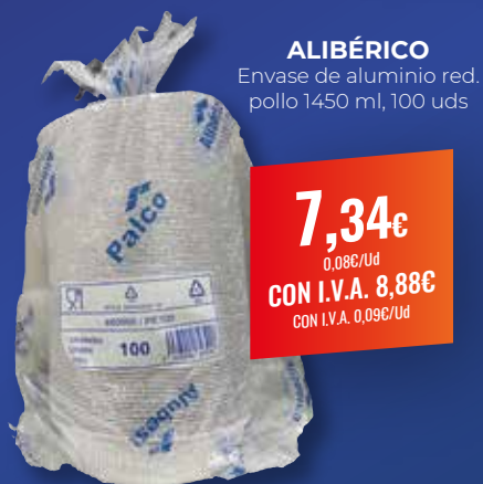
ALIBÉRICO Envase de aluminio red. pollo 1450 ml, 100 uds

2,36€ 4,72€/L CON I.V.A. 2,86€ CON I.V.A. 5,72€/L