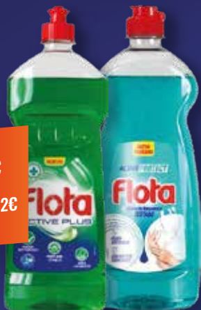
FLOTA Lavavajillas Active power / Active protect, 750 ml

0,76€ 1,02€/L CON I.V.A. 0,92€ CON I.V.A. 1,23€/L