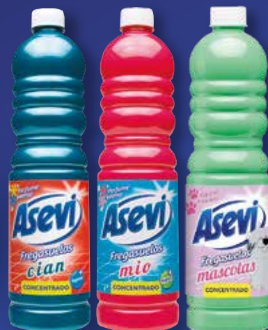
ASEVI Fregasuelos concentrado Cian / concentrado Mio / Mascotas concentrado 1 l

8,60€ 1,72€/L CON I.V.A. 10,41€ CON I.V.A. 2,09€/L