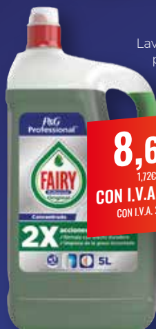
FAIRY Lavavajillas original profesional, 5 l

0,76€ 1,02€/L CON I.V.A. 0,92€ CON I.V.A. 1,23€/L