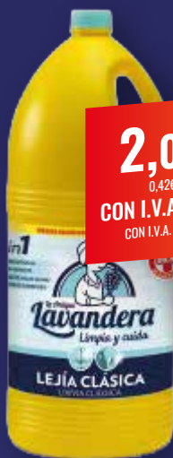
LA ANTIGUA LAVANDERA Lejía clásica, 5 l

2,09€ 0,42€/L CON I.V.A. 2,53€ CON I.V.A. 0,51€/L