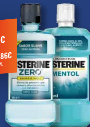
LISTERINE Enjuague Bucal zero / Elixir mentol 500 ml

2,36€ 4,72€/L CON I.V.A. 2,86€ CON I.V.A. 5,72€/L