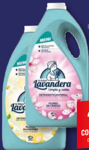
LA ANTIGUA LAVANDERA Detergente líquido Flor cerezo / Flores silvestres 90 lav