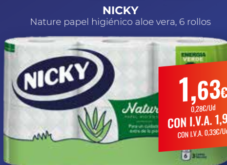
NICKY Nature papel higiénico aloe vera, 6 rollos

1,63€ 0,28€/Ud CON I.V.A. 1,97€ CON I.V.A. 0,33€/Ud