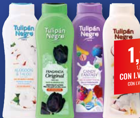
TULIPÁN NEGRO Gel Algodón y talco / Negro original / Candy fantasy / Pure white / Nube de algodón / Fresa y nata / Sugar melón, 650 ml

1,14€ 1,76€/L CON I.V.A. 1,38€ CON I.V.A. 2,13€/L