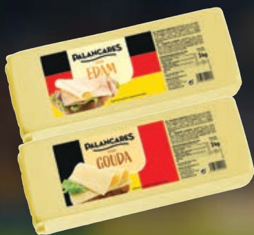
PALANCARES QUESO EDAM O GOUDA, EL KG