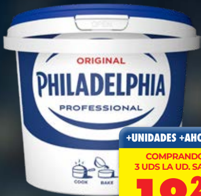
PHILADELPHIA QUESO CREMA 2 KG