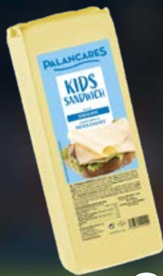
PALANCARES QUESO NEW SÁNDWICH EL KG