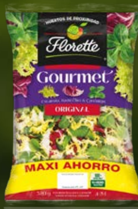
FLORETTE MAXI GOURMET 320 G