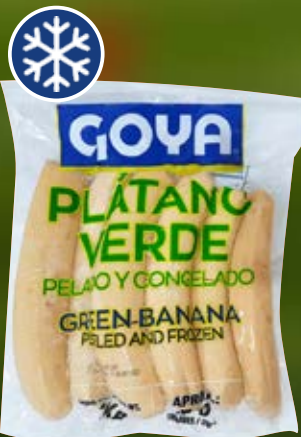
GOYA PLÁTANO VERDE 1 KG