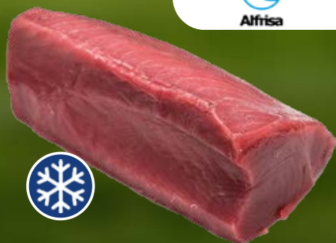
ALFRISA LOMO DE ATÚN PREMIUM EL KG