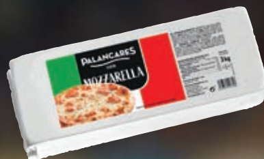
PALANCARES MOZZARELLA EL KG