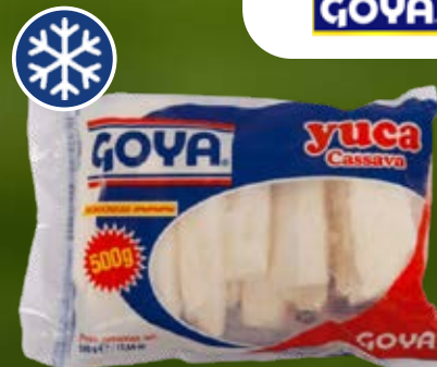
GOYA YUCA TROZOS 500 G