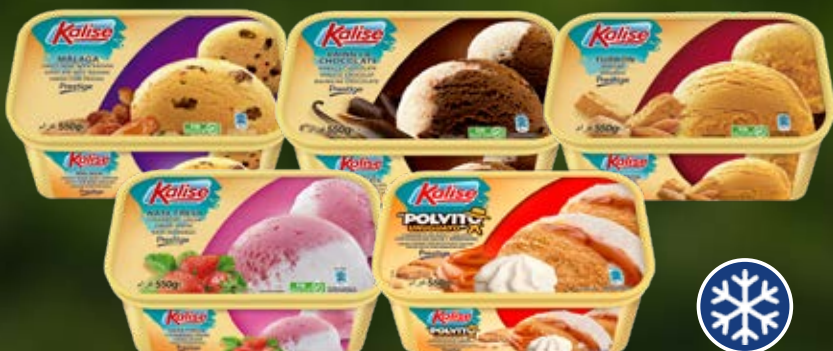
KALISE HELADO PRESTIGE VARIIDADES 550G