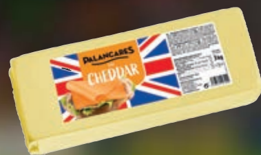
PALANCARES QUESO CHEDDAR EL KG