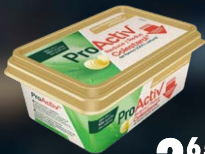
FLORA MARGARINA PRO-ACTIV 250 G